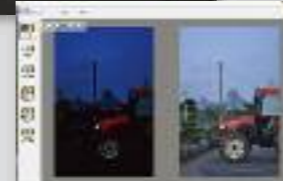
▼ 멀티 레이어 레이어 및 효과 레이어